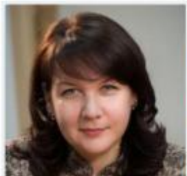
Наталья Наумова директор Департамента государственной политики в сфере воспитания, дополнительного образования и детского отдыха, Минпросвещения России

Изменения в локально- нормативных документах МБУ ДО-центр «Лик»!!!